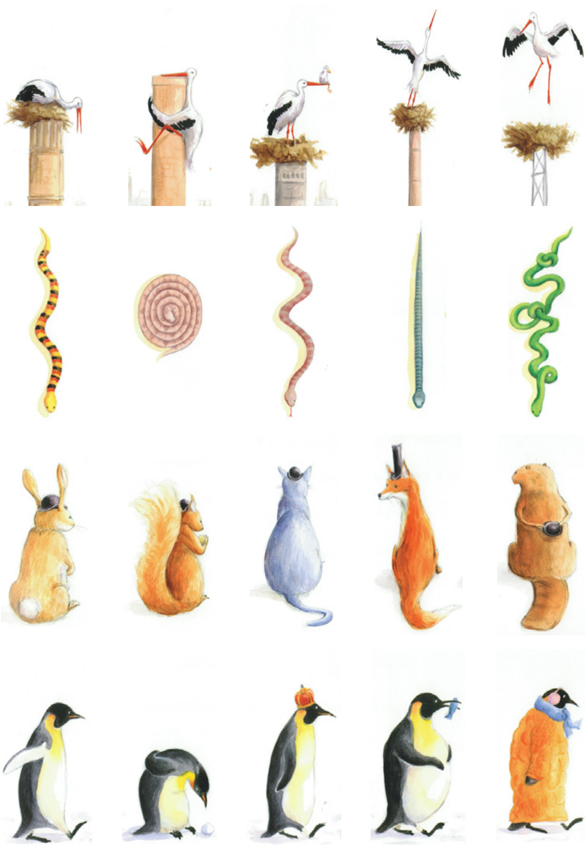
Béatrice Boutignon. Tous les animaux ne sont pas bleus. Le baron perché. Edigroup. Paris. 2007